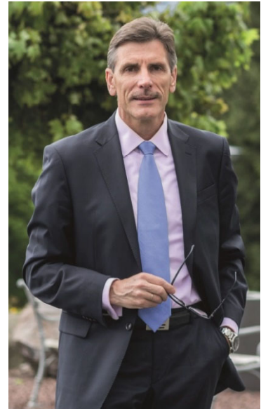
Klaus Jost

Hänssler ist die Qualitätsmarke in der christlichen Buch- und Medienbranche und steht für eine authentische, lebendige Beziehung zu Gott und den Menschen!